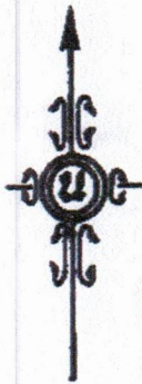
รูปแผนที่